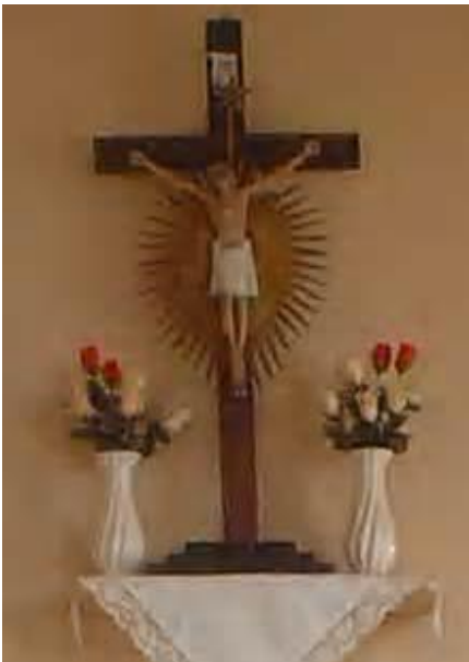
Imagem de São Bom Jesus da Lapa

O objetivo da realização da obra era o de pagar voto realizado e de graça concedida. A imagem do padroeiro da Igreja foi trazida da cidade de São Bom Jesus da Lapa, na Bahia, pelo fundador e sua família.