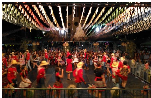
“Arraiá do Lageado”