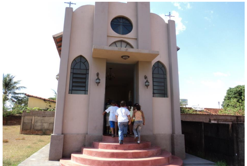
Capela restaurada após o seu tombamento.