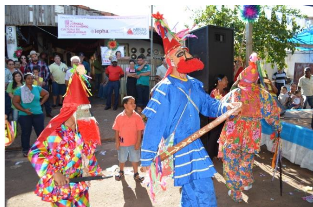
Encontro de Bandeiras de Reis